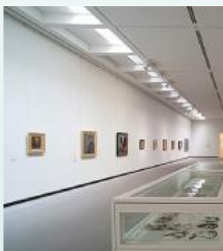
【照明のLED化】 美術館等県有施設の照明のLED化