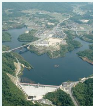
【小水力発電】 小水力発電所の設置に対する補助