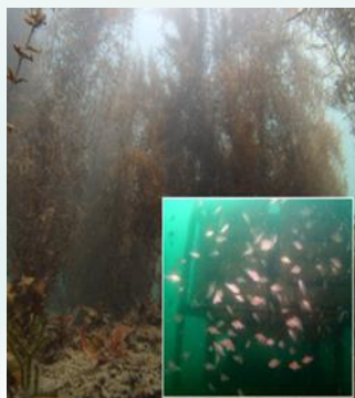
【漁場環境の保全】 瀬戸内海域における良好な漁場環境の創出