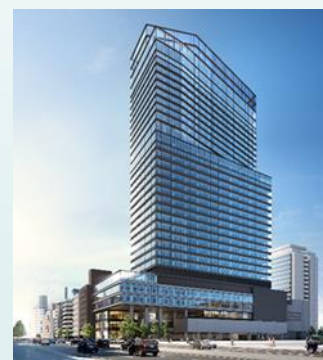
【市街地再開発事業】 脱炭素化に向けたサステナブルな都市再生